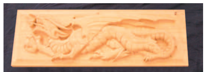
Drachen im Halbr relief von Jens-Ole Remmers.