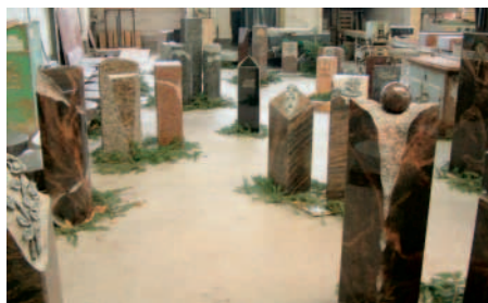
Eine große Auswahl verschiedener Grabmale präsentierte die Firma Eichhorn & Walter.