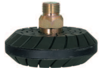
Die neuen kunstharzgebundenen Tropffläschenschleifbeläge DIAREX Joker 45°.

Die DIAREX Joker 45° sind ein exakt aufeinander abgestimmtes Werkzeugsystem zur Weiterbearbeitung der vorgefrästen Tropffläche und erhältlich in den Kornstufen K400, K800, K1 500, K3 000 und K8 000. Als Aufnahmen sind R1/2"-Anschluss, Tornado-Anschluss oder das Speed-Fix-System der Firma König möglich.