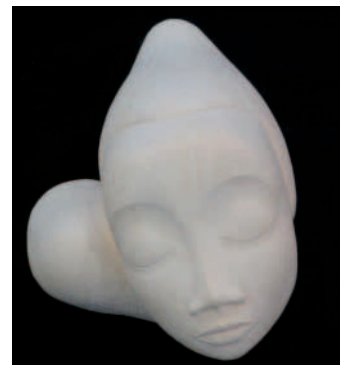
Weiblicher Kopf von David Grimme.