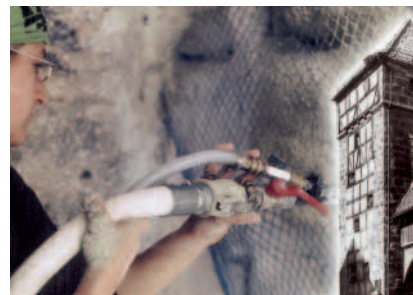
Denkmalschutz mit Poraver. Dem beschädigten Sandstein kann deutlich mehr Salz entzogen werden.

Monolith Bildhauerei und Steinrestaurierung GmbH Waizendorfer Straße 11 96049 Bamberg Tel.: 09 51 / 5 10 87 Fax: 09 51 / 5 55 38 E-Mail: info@monolith-steinrestaurierung.de