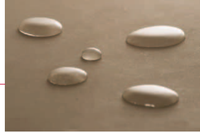
Innovativer Fleckschutz mit MKS »Thilos«.

Beide »Thilos«-Produkte sind absolut farbneutral und auch auf restfeuchten Böden zu verarbeiten. Der Schwerpunkt wurde bei den Produkten auf sehr gute