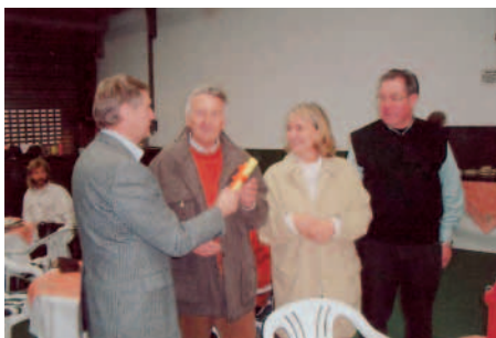
Übergabe des Reisegutscheins an die Geschäftsführung der Firma Hoffmann, Heidelberg.

Exklusivornamente aus Kunststoffguss. Darüber hinaus wurde eine Vielzahl von Reihen- und Breitsteinen sowohl aus deutscher, als auch aus indischer und chinesischer Produktion präsentiert. Die Firma K & B betont, dass sie keine Produkte anbietet, die mit Kinderarbeit hergestellt wurden. Entsprechende Zertifikate können abgegeben werden. Zu den Mitausstellern, die den