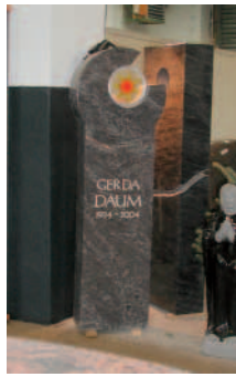
Stele mit Glas- ornament.