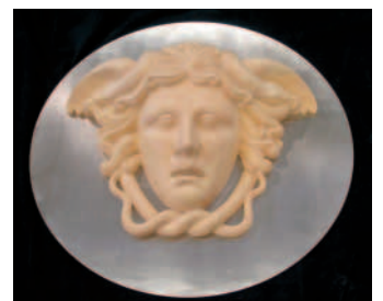
»Haupt der Medusa« von Matthias Münch.