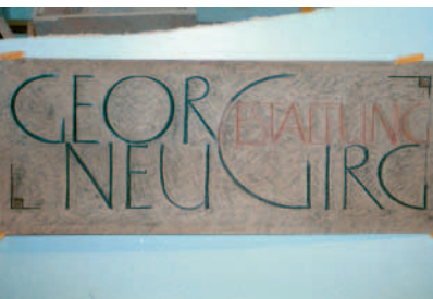
Gelungene Gestaltung eines Firmenschildes.

spricht sie mehr an«, erklärte er. Jeder Totenkult sei für die Lebenden da, nicht für die Toten. In einer Zeit, in der das Individuum keine Rolle mehr spiele, würden auch nur selten individuelle Denkmale gesetzt. Holländer und Hafner sehen die gegenwärtige Situation als Chance für diejenigen, die wirklich mit Bedacht gestalten wollen und können. Viele Menschen würden gerne ein gut gestaltetes Zeichen setzen, wüssten aber nicht, wer so etwas gestalten kann. Daher sei es äußerst wichtig, über alle Möglichkeiten des Abschiednehmens zu informieren, durchaus auch über moderne Medien wie das Internet. Der Information dient auch das von der Firma Strassacker entwickelte und 2004 im Ebner Verlag erschienene Buch »Du fehlst mir ...«, das Günter Czasny, stellvertretender Geschäftsführer der Firma Strassacker, ausführlich prä-