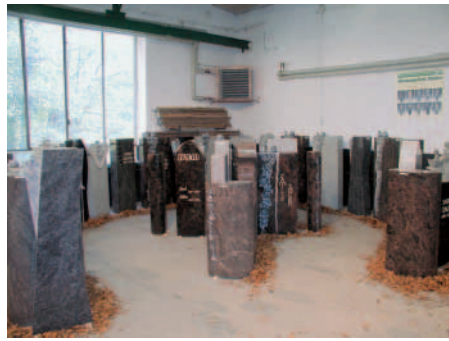
Blick in die Ausstellung.

Die Preise: zwei einwöchige Kreuzfahrten auf der Aida für jeweils zwei Personen. Gewinner sind die Firma Norwig aus Borken und die Firma Hoffmann aus Heidelberg. Tel.: 0 62 55 / 9 60 90 Internet: www.boehringerganit@aol.com