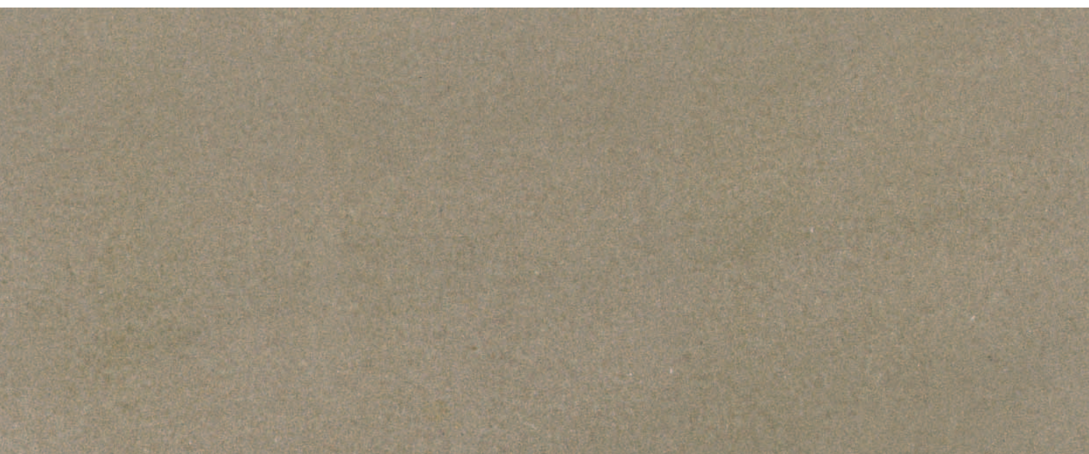
Sandstein BAD KARLSHAFEN