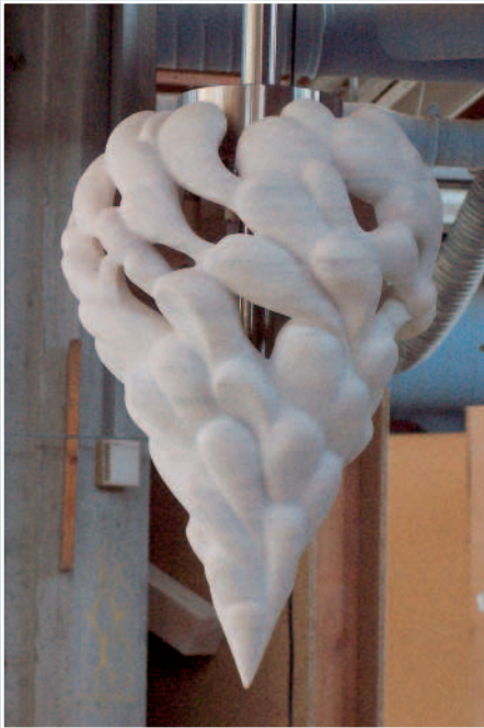
Björn Bauer, »Energie bewegt«, KASHMIR MARMOR, 40 x 40 x 40 cm.