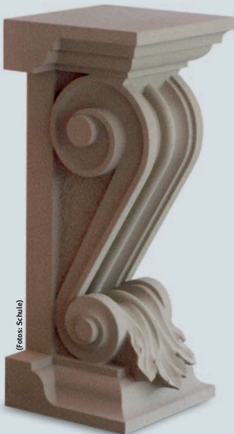
André Iseli, »Konsole«, BERNER SANDSTEIN, 38 x 36 x 90 cm.

Weitere Informationen über die Meisterstücke bietet die Homepage der Meisterschule: www.fwg-freiburg.de <