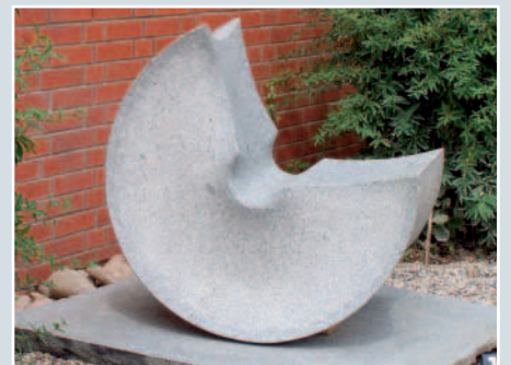
Edwin Petri, »Sessel«, BAYERWALD GRANIT, 99 x 96 x 66 cm.