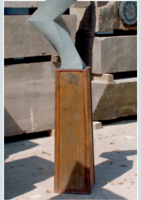
Michael Kaufmann, ohne Titel, Anröchter Kalksandstein, 102 x 65 x 18 cm.