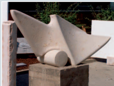
Florian Lechner, »Amorphe Form über Zylinder«, Jurakalkstein, 149 x 57 x 32 cm.