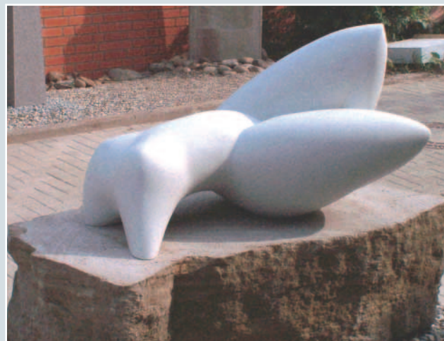
Oliver Venohr, »Ruhende Erwartung« Carrara-Marmor, 110 x 70 x 75 cm.