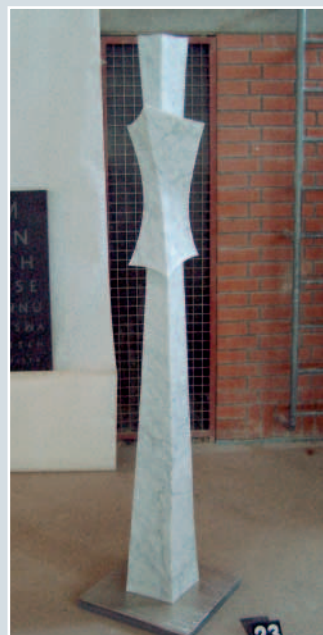
Daniel Graf, »Korsett«, Carrara-Marmor, 197 x 30 x 30 cm.