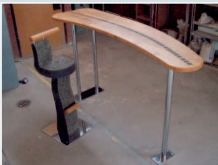
Simon Aiwanger, »Stuhl«, TANO DIORIT, 41 x 41 x 125 cm.