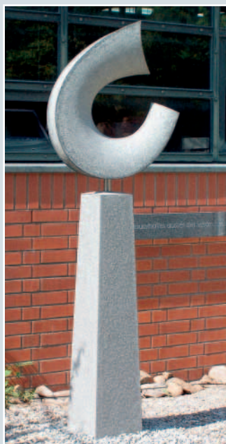
Marco Haug, »Licht und Schatten«, IMPALA, 75 x 60 x 24 cm und 120 x 27 x 27 cm.