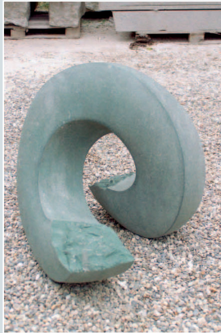
Barbara Ehrhardt, »Spirale«, Anröchter Kalksandstein, 94 x 78 x 80 cm.