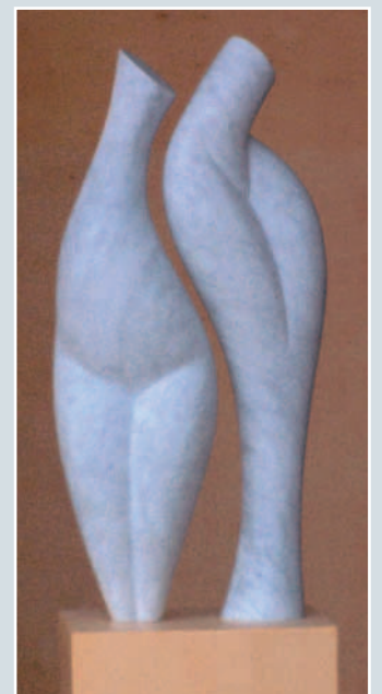
Bertolt Schöne, »Beziehung«, Carrara-Marmor, 100 x 30 x 20 cm.