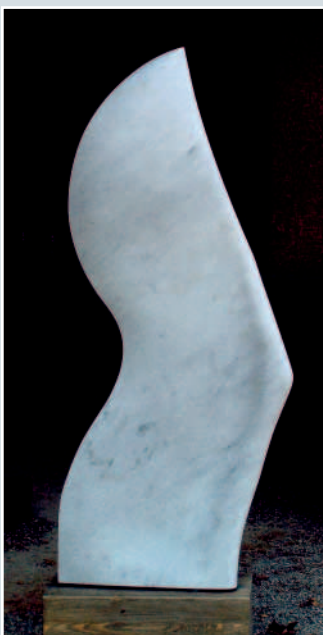
Riccardo Itta, »Flügel«, Carrara-Marmor, 170 x 28 x 75 cm.