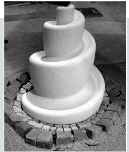
Martin Röttger, »Quellstein«, Kalkstein OCEAN BEIGE, Oberfläche geriffelt, 75 x 75 x 86 cm.