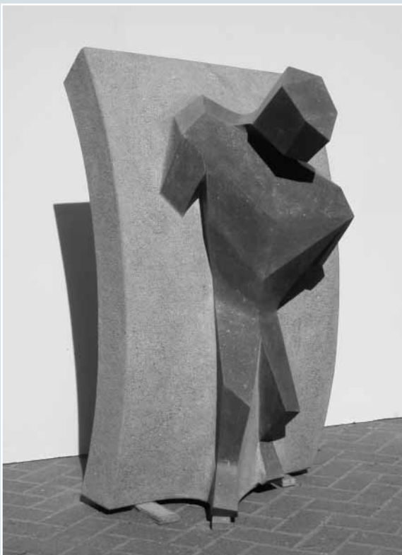
Olaf Syhre, »Leben«, IRISH BLUE LIMESTONE, Oberfläche geschliffen, gestockt und gespitzt, 70 x 70 x 125 cm.