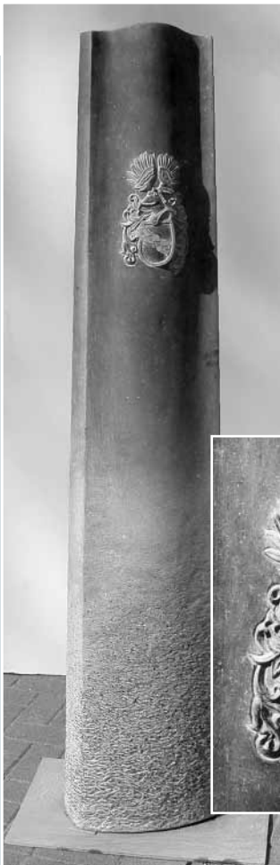
Patrick Kielmann, Stele mit Wappen, IRISH BLUE LIMESTONE, Oberfläche von gespitzt zu geschliffen, 35 x 25 x 170 cm.