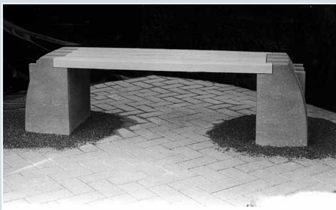
Frank Knippenberg, »Bank«, ANRÖCHTER DOLOMIT, Oberfläche geriffelt und geschliffen, 160 x 45 x 45 cm.