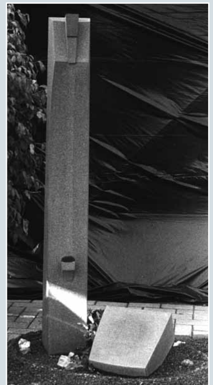
Robert Naunheim, »Lebensstele«, SHWARZ SCHWEDISCH, Oberfläche geriffelt, 30 x 30 x 168 cm.