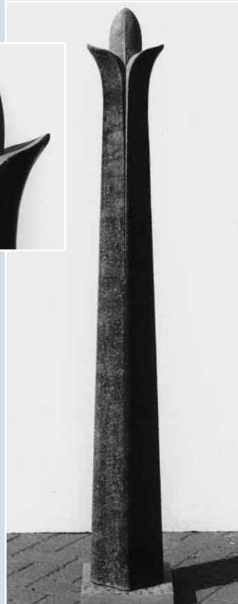
Dana Szudrowicz-Jansen, »Wachstum«, Diabas, Oberfläche frei vom Hieb und geschliffen, 25 x 25 x 170 cm.