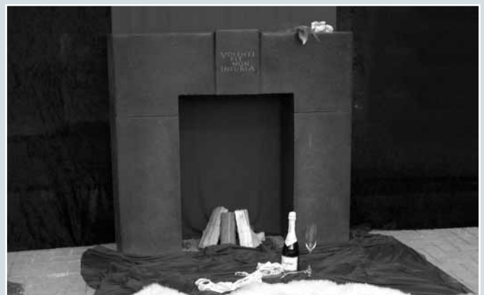
Adrian Pientka, »Kamin«, SCHWARZ SCHWEDISCH, Oberfläche matt geschliffen, 130 x 35 x 122 cm.