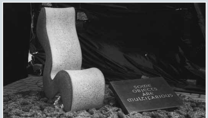
Klaus Schillalis, »Sitzobjekt«, IRISH BLUE LIMESTONE, Oberfläche gestockt und überschleift, 96 x 35 x 106 cm.