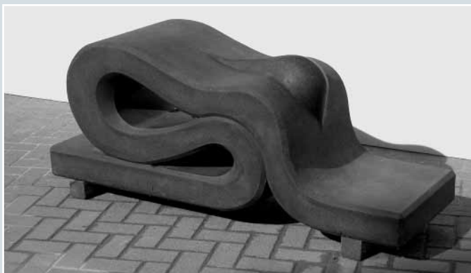
Kerult Kuttler, »Betende«, INDIAN BLACK, Oberfläche gestockt, 60 x 150 x 80 cm.

Eine kritische Stellungnahme der Absolventen und Absolventinnen dieses Meisterjahrgangs finden Sie im »Leserforum« auf S. 16.