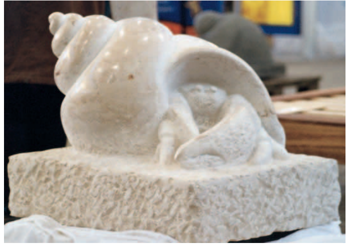
Einsiedlerkreb im Schneckenhaus – auf den ersten Blick eine schöne Arbeit, aber handwerklich nicht befriedigend, urteilten die Juroren.