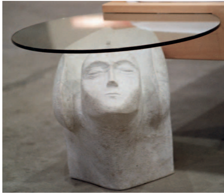
Bettpfosten aus Jura, formal nicht durchgearbeitet.

wenn es um den Berufsnachwuchs geht. Werner Kleffel sprach am Ende der Sitzung die Fragen aus, die alle Juroren beschäftigten: »Wie kann es sein, dass die kritisch beurteilten Stücke auf Landesebene gut benotet und für die Beteiligung am Wettbewerb ›Die gute Form‹ vorgeschlagen wurden? Warum haben die Ausbildungsbetriebe die jungen Leute dazu ermutigt, sich an einem bundesweiten Wettbewerb mit Arbeiten zu beteiligen, die mit augenfälligen Mängeln behaftet sind? Haben es die Ausbilder gut gemeint und beide Augen zugedrückt?« Wenn dem so ist, haben sie den Wettbewerbsteilnehmern keinen Gefallen getan.