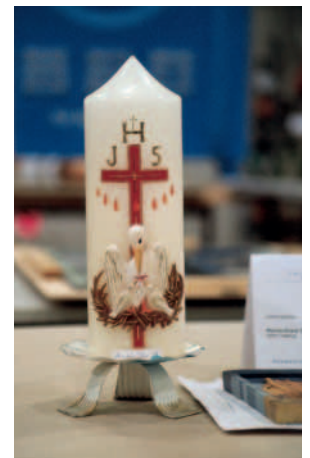
Am Rande: In der Nachbarschaft standen auch Wettbewerbsstücke der Wachszieher. Unsere Juroren freuten sich zumindest darüber, dass sie diese Arbeiten nicht bewerten mussten.