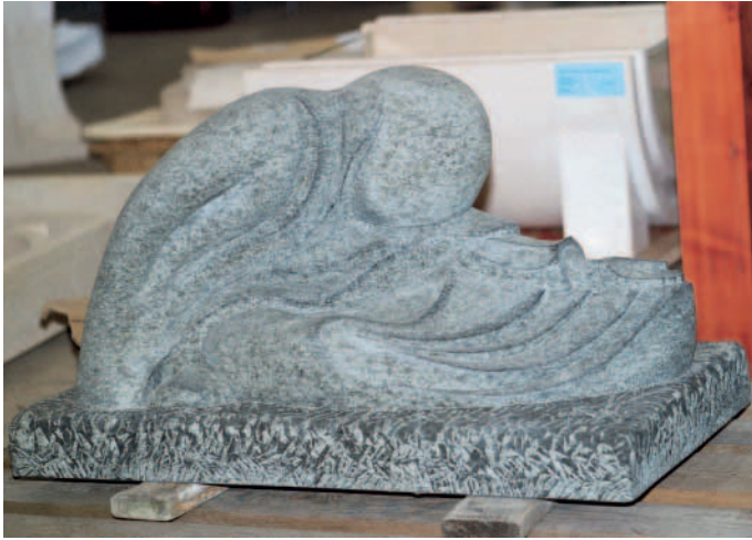
»Die Bettlerin« konnte die Juroren nicht überzeugen.