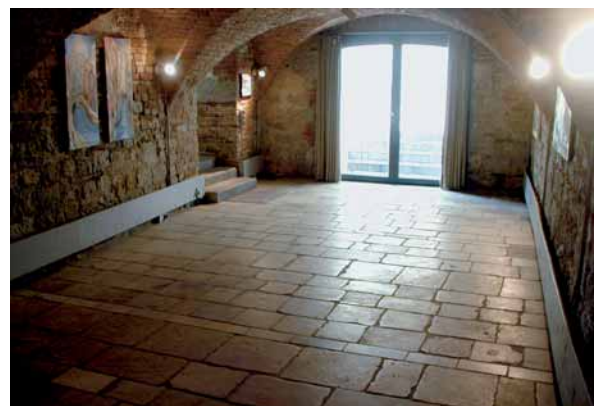
Bleibt über Dekaden schön: gut behandelter Kalksteinbelag