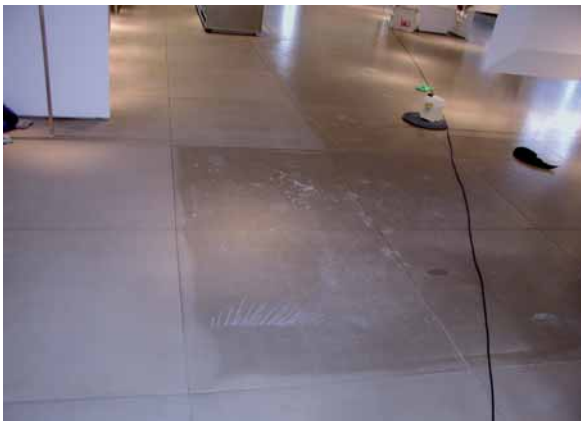
Mit ALPINCHEMIE Grundreiniger - neutral - ließ sich dieser falsch gepflegte Kalkstein wieder in den Urzustand versetzen.

Ist der Natursteinbelag erst einmal gereinigt und durch eine Imprägnierung (z.B. ALPINCHEMIE