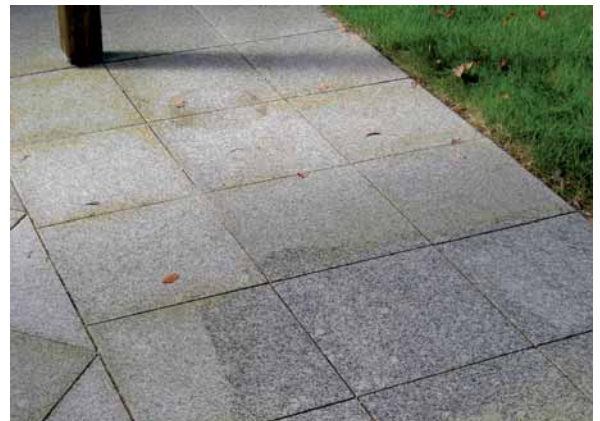
ALPINCHEMIE Rostumwandler für Granite entfernt wirksam und nachhaltig Rostflecken von säurestabilen Natursteinbelägen.