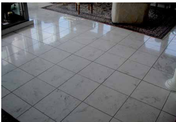
Richtig gereinigter und gepflegter Jurakalksteinbelag

Für eine milde und schonende Reinigung im privaten Bereich eignet sich bestens unser Produkt HMK® P 24 Edel-Steinseife. Dieser milde Naturseifenreiniger aus hochwertigen Naturölen garantiert ein gründliches Reinigen verbunden mit anhaltender Pflege. Die aktiven Reinigungswirkstoffe lösen den Schmutz von der Oberfläche ab, sodass er sich leicht aufnehmen lässt. Durch die Pflegekomponenten wird die natürliche Farbstruktur hervorgehoben und ein schönes, farbintensives, gepflegtes Aussehen erreicht. Bei regelmäßiger Anwendung werden die Flächen pflege-